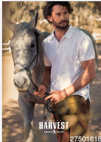
Réf. 27501618 Qtés