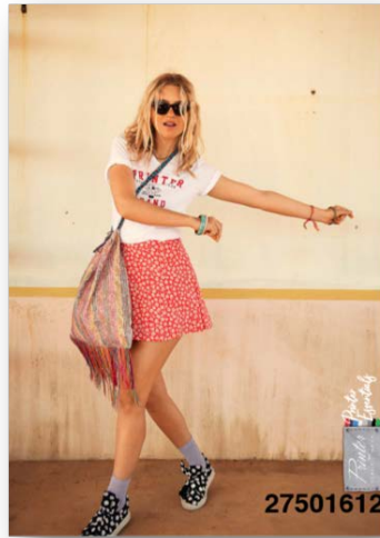
Réf. 27501612 Qtés