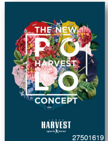
Réf. 27501619 Qtés

Merci de bien vouloir retourner ce bon de commande par mail à contact@texet.fr Vos posters vous parviendront sous 48/72H