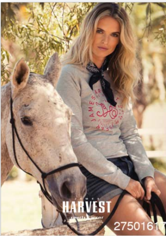
Réf. 27501617 Qtés