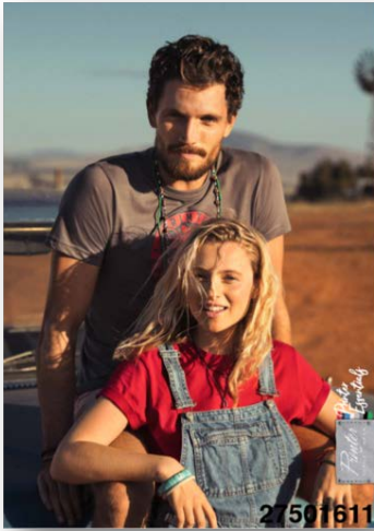
Réf. 27501611 Qtés